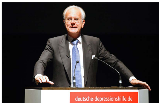
Gewohnt hinterzünftig führte Schauspieler und Entertainer Harald Schmidt durch den Patientenkongress Depression.

Am 12. und 13. September 2015 veranstaltete die Stiftung Deutsche Depressionshilfe gemeinsam mit der Deutschen DepressionsLiga den 3. Deutschen Patientenkongress im Gewandhaus zu Leipzig. Mehr als 1.300 an Depression